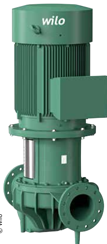
Einstufige Niederdruck-Kreiselpumpe in Inline-Bauart

Um die erforderlichen Kühlwassermengen bereitstellen zu können, sind die Trockenläuferpumpen als Inliner horizontal in die Rohrleitungsstrecken installiert. Die Rohrdimensionen der Kühlkreisläufe gehen von DN 150 bis