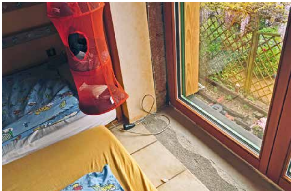
Die potenziellen Wärmebrücken an Fenstern und Balkontüren sind mit einer Isolierschüttung derart minimiert, dass sie KfW 55 nicht gefährden