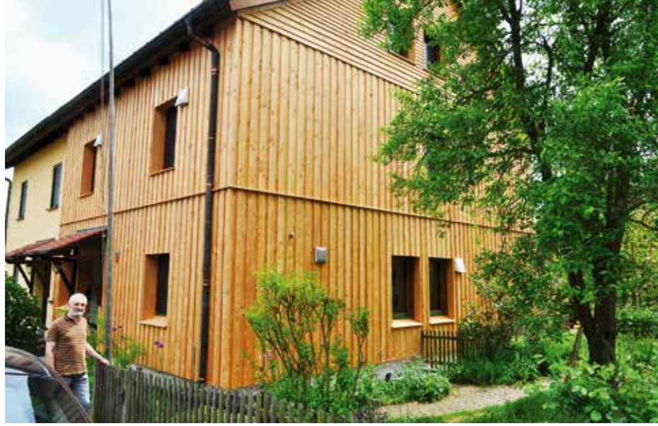
Die beheizte Wohnfläche beträgt insgesamt 160 m 2 , davon 120 m 2 Fußbodenheizung und im Dachgeschoss Heizkörper. Neben den Fenstern die Lüftungsventile der dezentralen Be- und Entlüftungsgeräte mit Wärmerückgewinnung. Im Bild Christof Bärhausen

Wie funktioniert's? Zur Grundeinstellung müssen auch am RTB raumbezogene Erfahrungswerte dienen, wie üblich bei Thermostatventilen. Ein Beispiel: Im Schlafzimmer sollen 18 °C sein.