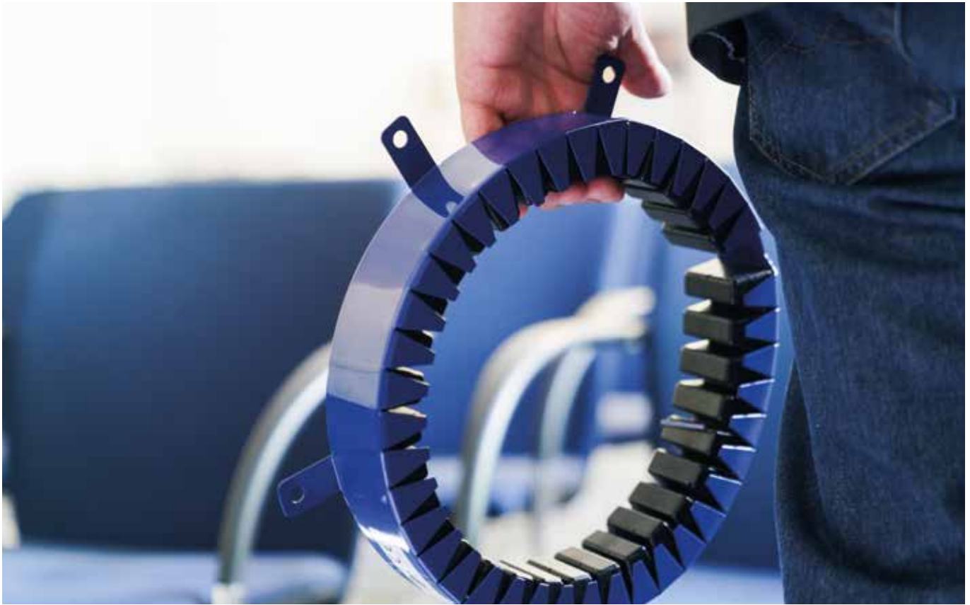
| Curaflam® XS Pro Brandschutzmanschette