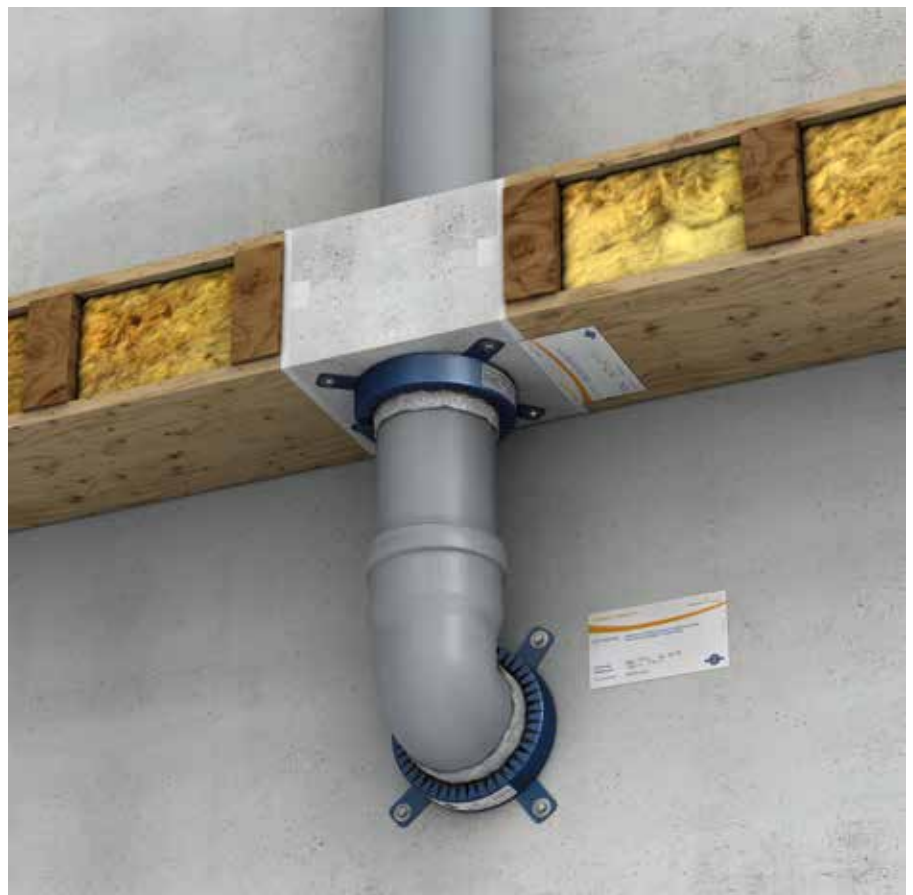
! Verwendung einer Curaflam XS Pro in Kombination mit einem Abwasserrohr unter einer Holzbalkendecke.